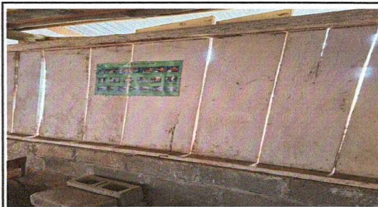
Foto 4: Se observa deterioro de pintura de las puertas y paredes.